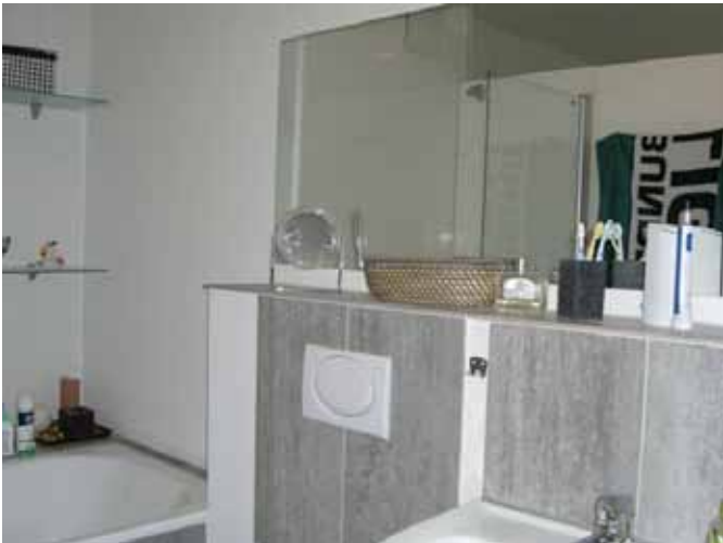
Bad - Bild 2