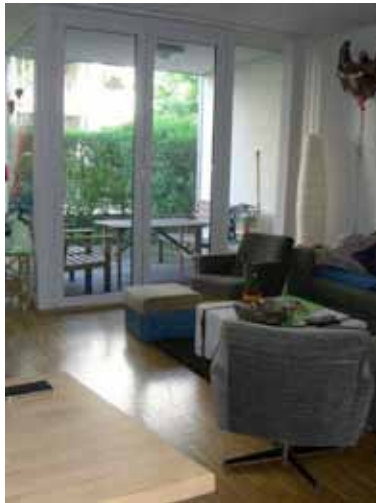
Wohnen, hinterer Bereich