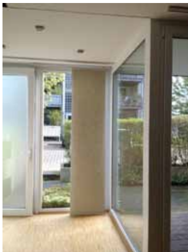
Eingang + Terrasse - Teilbereich