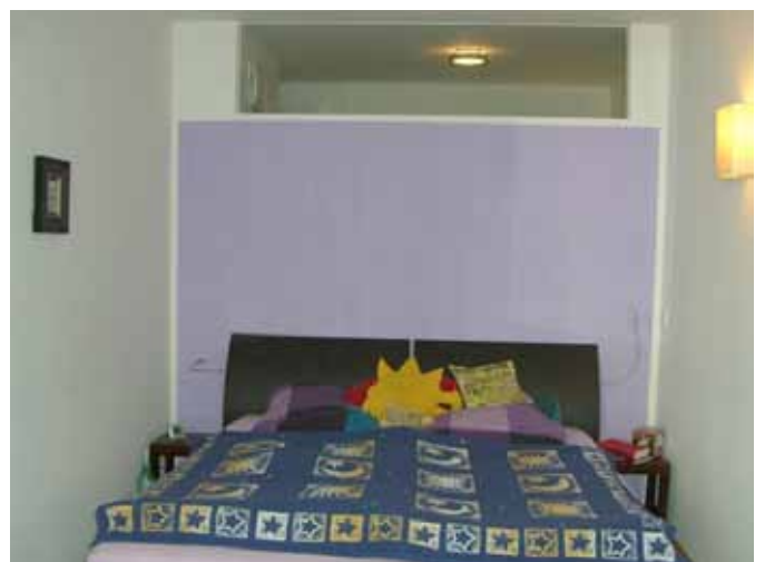
Beispiel: Schlafen + Oberlicht Bad