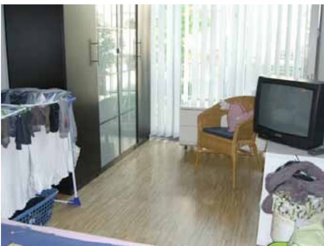
Schlafen - Bild 2 / Lamellen gehören zur Wohnung