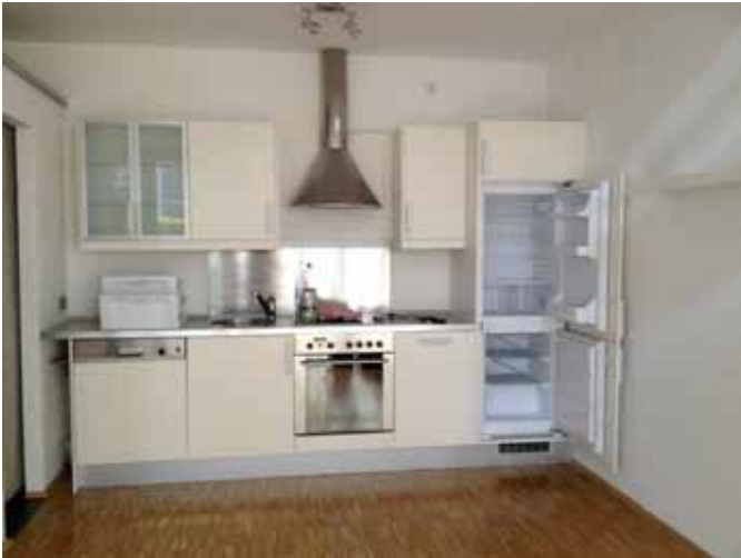
Blick auf Einbauküchenzeile