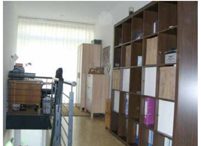
Bürobereich im OG - Lamellen gehören zur Wohnung