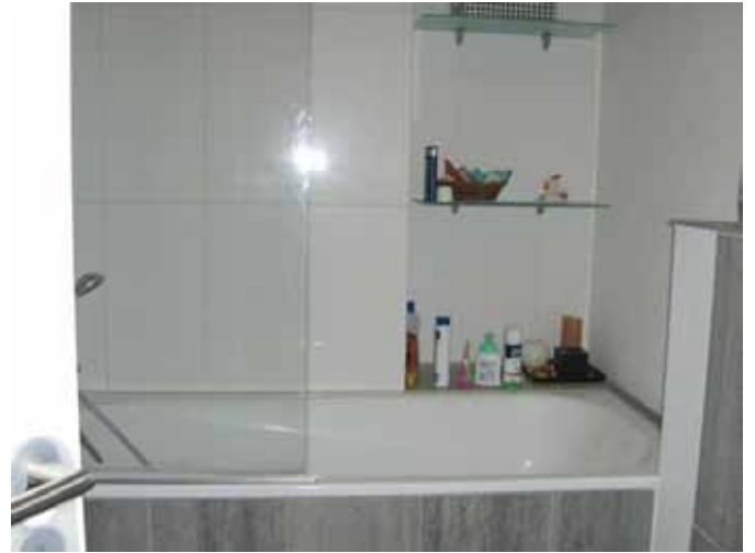
Bad - Bild 1