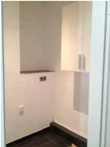
Blick in Abstellraum + Waschmasch.-Anschluß