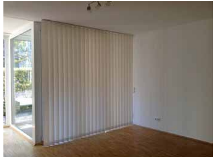
Teilbereich - Wohnen im EG - leer stehend