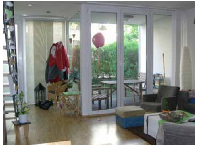
Beispiel: Wohnen + Terrasse hinten