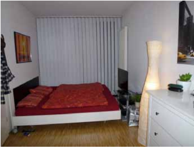
Beispiel Schlafen - obere Ebene