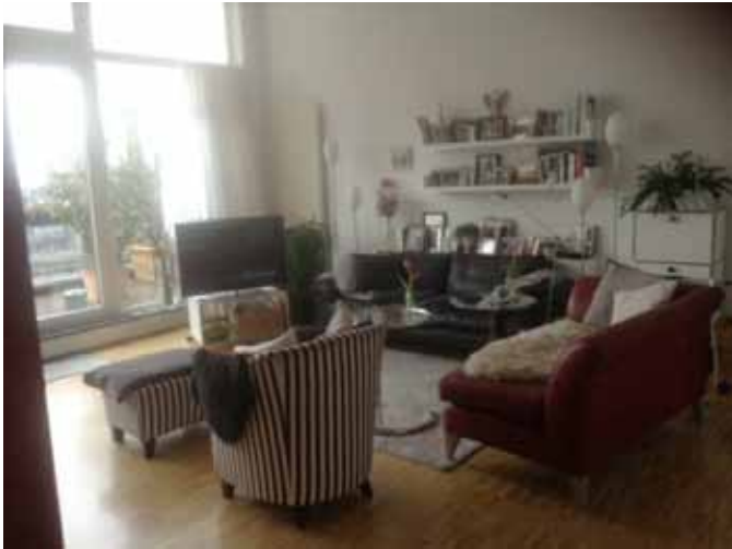
Wohnen - Teilbereich