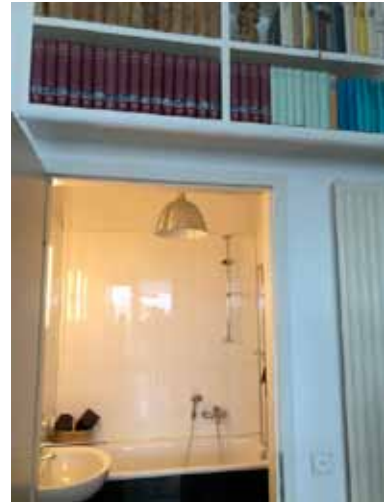
oben hochwertiges Bücher-Regal - unten Gäste-Bad