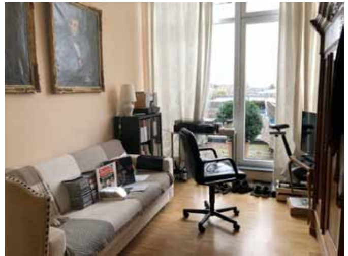
Gäste-Zimmer - Schlafzimmer 2