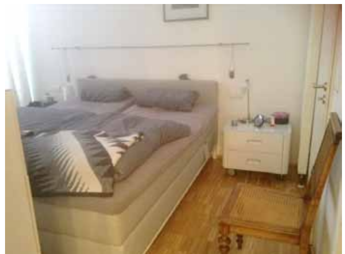
Schlafen 1 - Bild 2