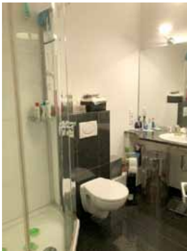
Bad an Schlafzimmer 1 - Bild 1