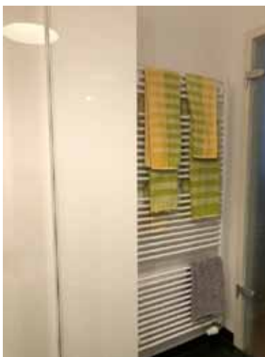
Bad an Schlafzimmer 1 - Bild 3