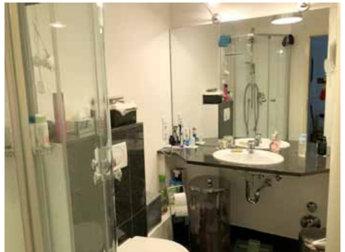
Bad an Schlafzimmer 1 - Bild 2