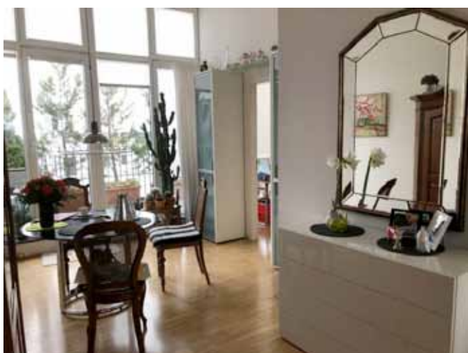
Essen - Zugang zur Süd-Ost-Terrasse- rechts Büro