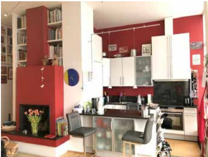
Wohnen mit Kamin - offene Küche