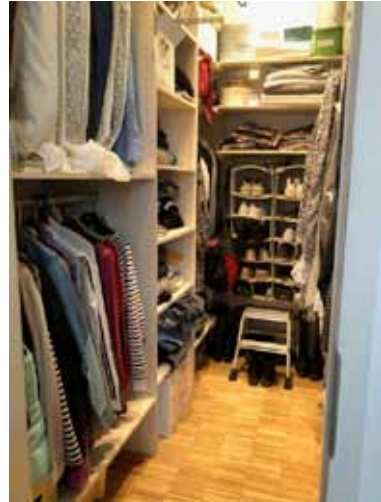
Begehbarer Kleiderschrank /Ankleide