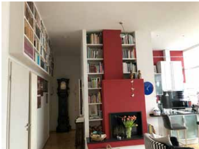
Wohnen und Flur zu 2 Schlafzimmer / Bad