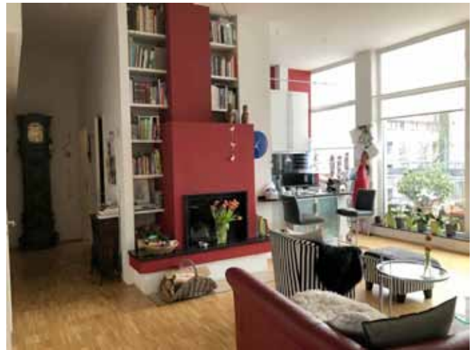
Wohnen - Kamin - Küche - West-Terrasse