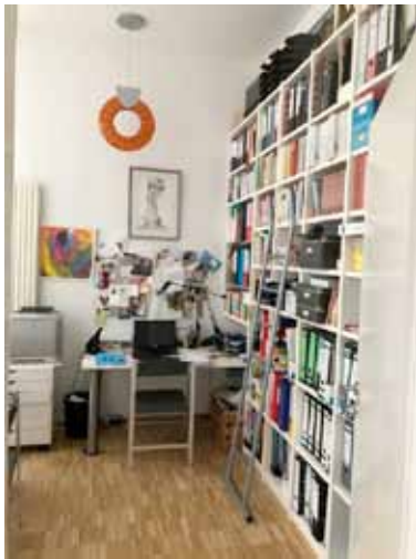
Büro - Bild 2