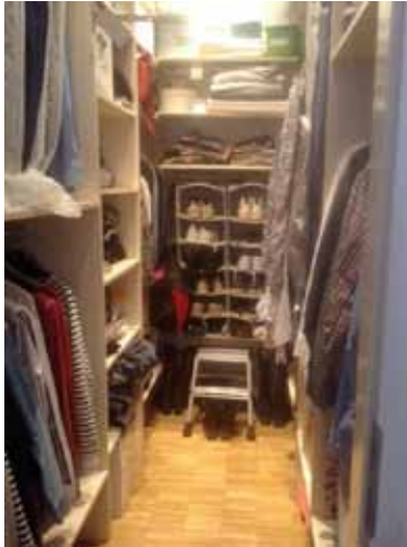
Begehbarer Kleiderschrank / Ankleide