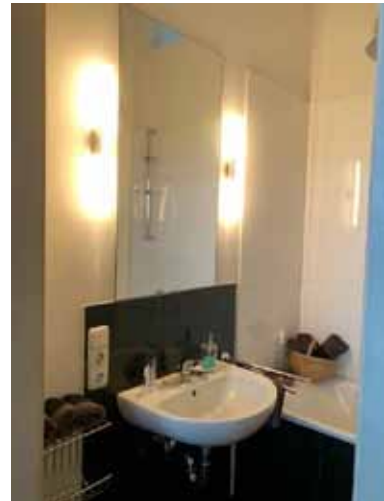
Gäste-Bad - Bild 3