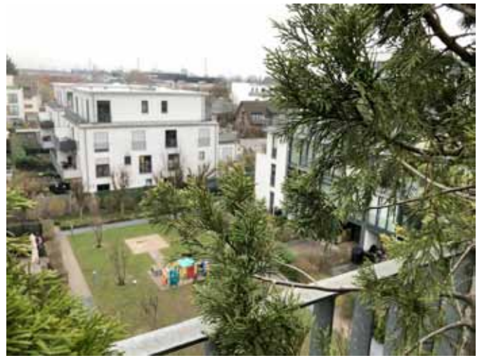
Ausblick Süd-Ost-Lage - Terrasse