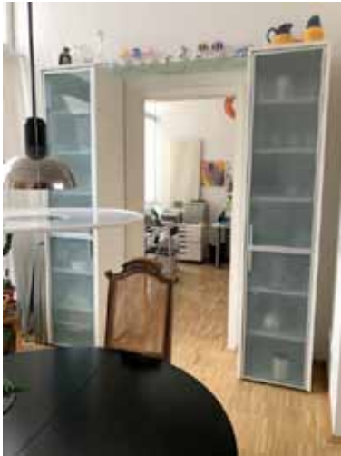
Zugang von Essen ins 3. Zimmer (Büro)