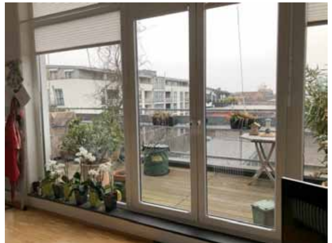
Terrasse - West-Lage