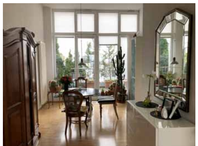
Eingangsbereich - Essen - Süd-Ost-Terrasse