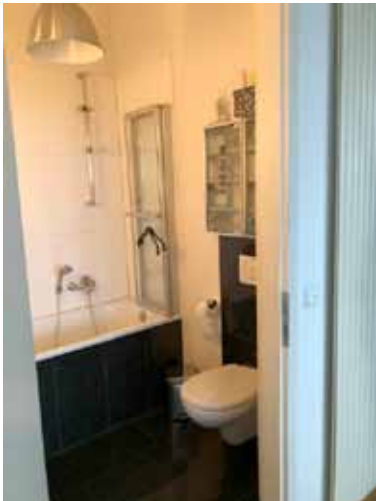
Gäste-Bad - Bild 2