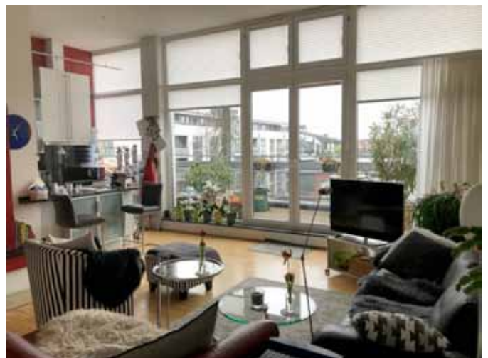
offenes Wohnen - Kochen - West-Terrasse