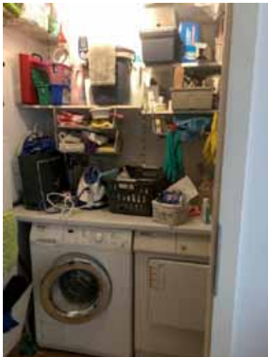
Blick in AB /Waschraum