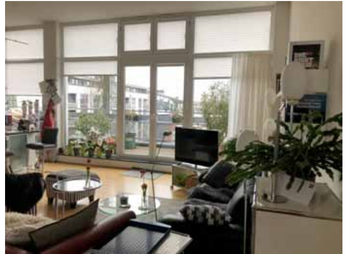
Teilbereich Wohnen - West-Terrasse