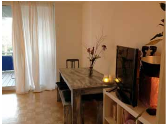
Beispiel: Wohnen - rechte Seite