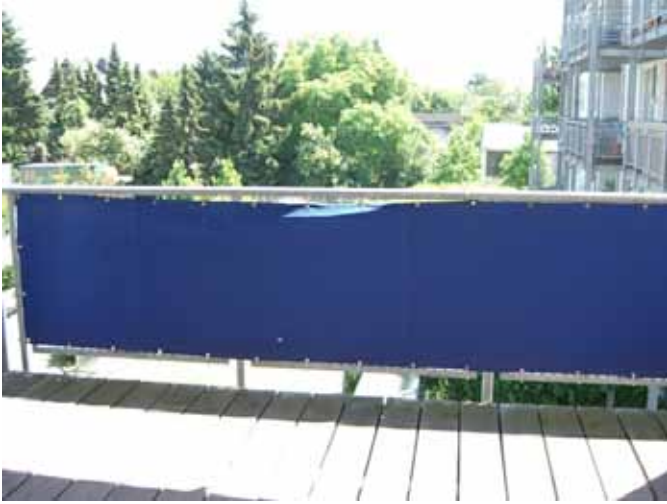
Überdachter Balkon - Loggia