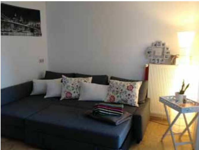
Beispiel: Wohnen - Couch-Ecke