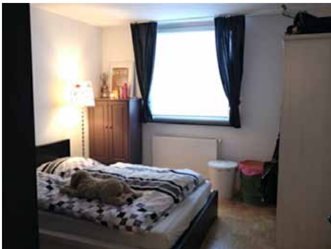
Beispiel: Schlafen- Fensterseite