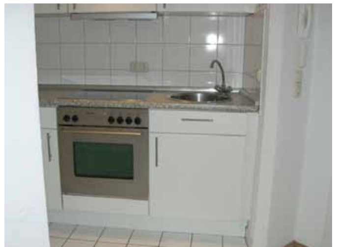
Eckwinkel-Küche - Bild 2