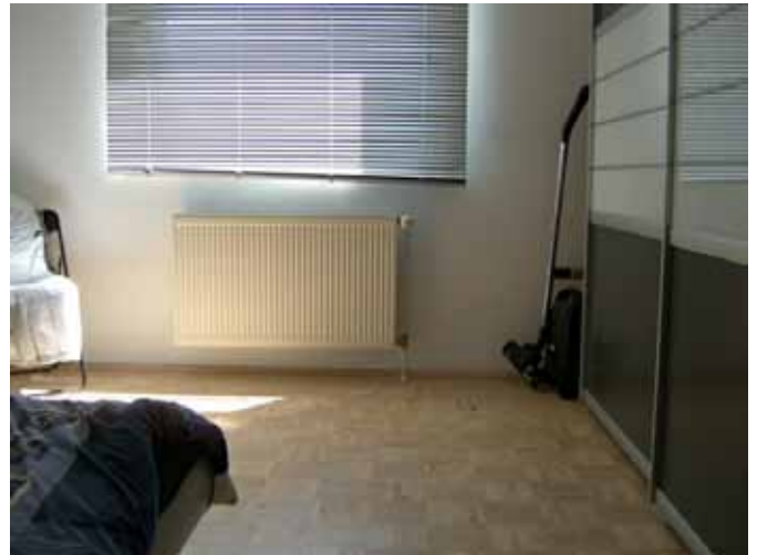
Schlafen - Bereich Fenster