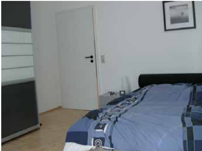
Schlafen - hinterer Bereich- Beispiel-Mobiliar