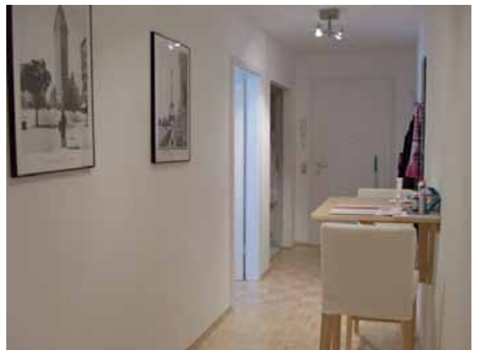
Flur / Diele - Beispiel-Mobiliar