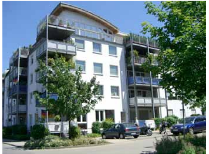
Aussenansicht - Hauseingang