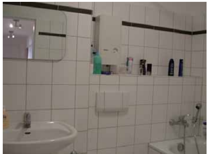
Bad - Bild 1