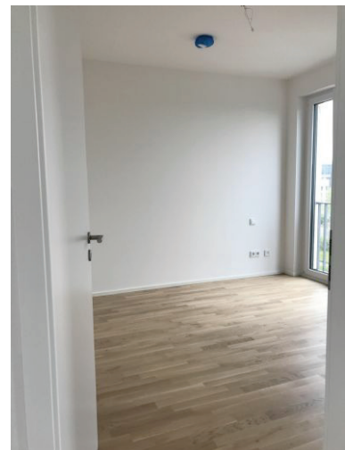
Schlafen - TV-Anschluß 2 - Bild 1