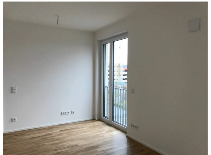
Wohnen-Essen- Bild 3