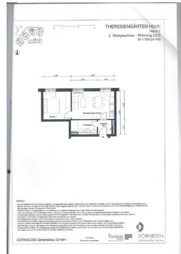
Grundriss - siehe auch pdf-Anhang