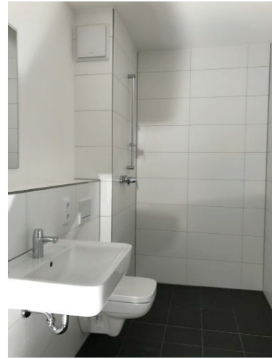
Bad mit bodentiefer Dusche