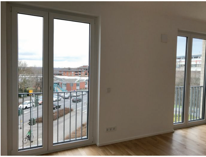
Wohnen-Essen - Bild 1