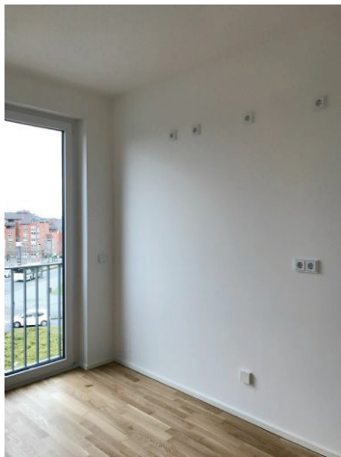
Küchenseite erhält neue Einbau-Küchenzeile !!