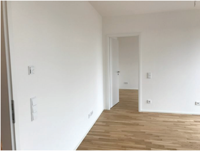
Zugang von Wohnen-Essen ins Schlafzimmer